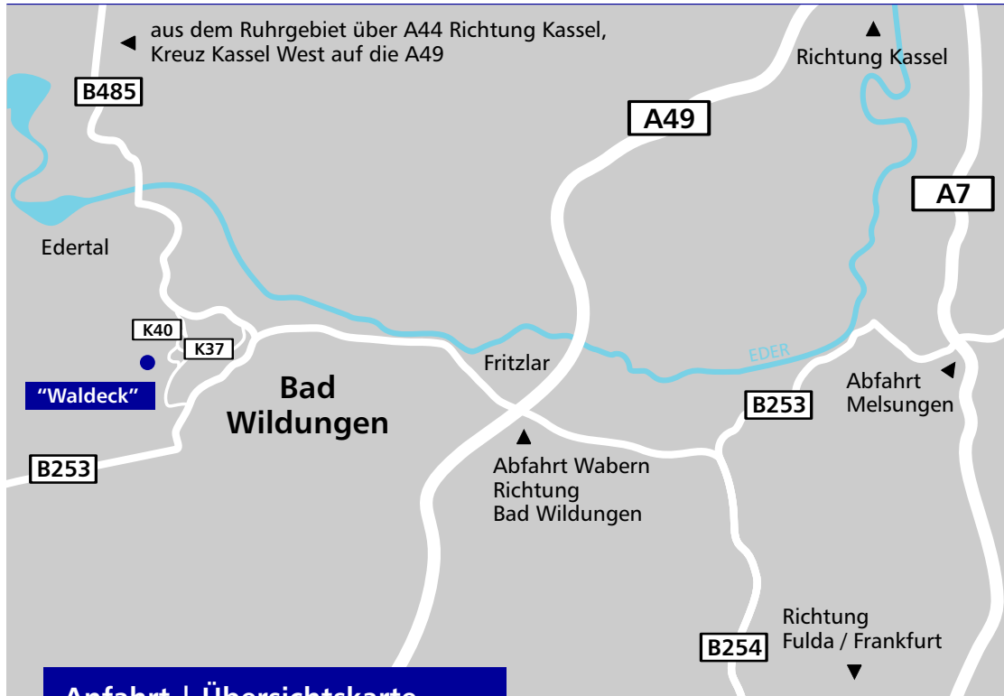
Anfahrt | Übersichtskarte

Telefon 05621 75248-0 Fax 05621 75248-21 E-Mail info@betreuungszentrum-waldeck.de Internet www.betreuungszentrum-waldeck.de